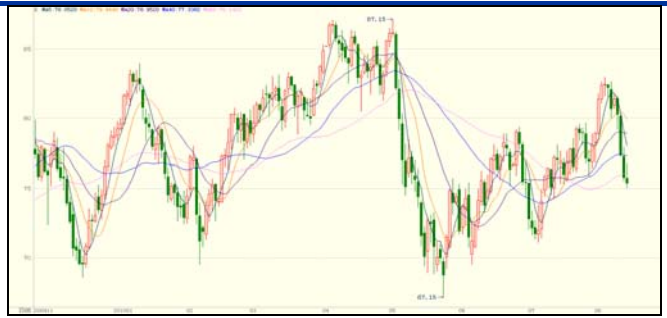
原油期货与国际现货金叠加图