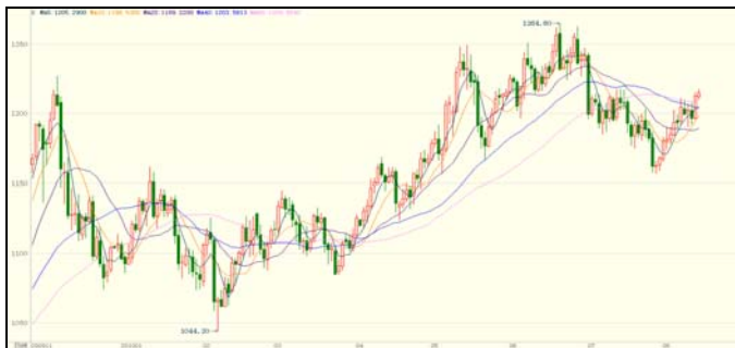
国际现货黄金日线图