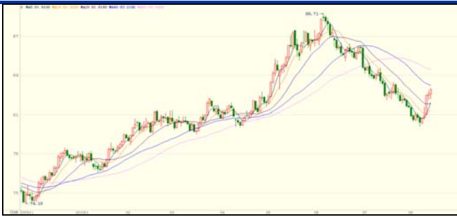
美元指数与国际现货金叠加图