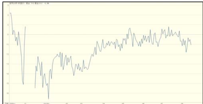
AU ( T+D ) 与黄金期货价差图