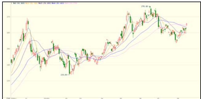
金交所 AU ( T+D ) 日线图