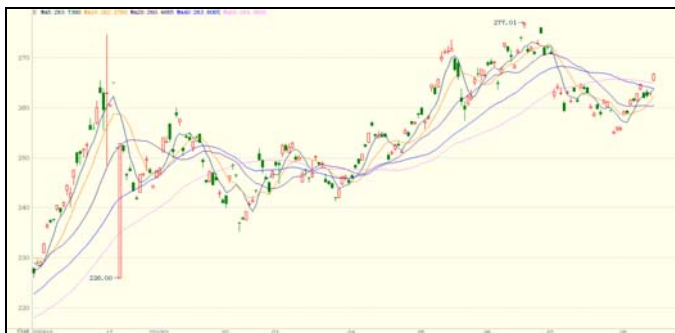
上期所期金 1012 合约日线图